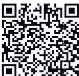
รายละเอียดหลักสูตร