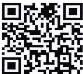
รับสมัคร