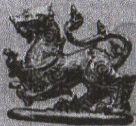
ราชสีห์ทองคำ จำนวน ๒๖๐ องค์ สำหรับผู้บริจาคเงิน ๕๐,๐๐๐ บาท

จำนวน ๑,๓๐๐ องค์ สำหรับผู้บริจาคเงิน ๑๓,๐๐๐ บาท