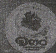
พระพุทธรูปนิคริประธานาถ