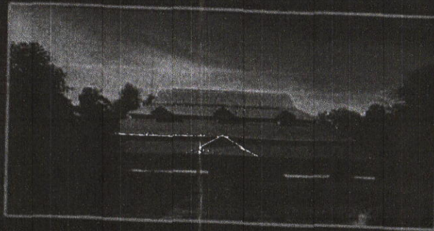
ภาพสถาปนาปฏิบัติธรรมสมเด็จพระสังฆราช (อมฺพรมหาราช) ตำบลคลองเก้า อำเภอลำลูกกา จังหวัดปทุมธานี