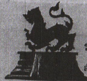
ราชสีห์ใหญ่โลหะพิเศษ จำนวน ๒,๕๖๕ องค์ สำหรับผู้บริจาคเงิน ๑๐,๐๐๐ บาท