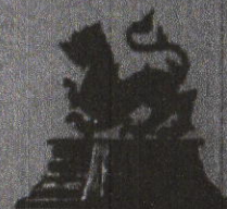
ราชสีห์ใหญ่โลหะพิเศษ