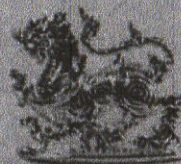
ราชสีห์เงิน