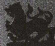
ราชสีห์รมดำ