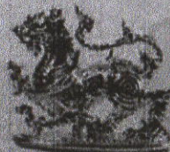
ราชสีห์เงิน จำนวน ๒,๕๖๕ องค์ สำหรับผู้บริจาคเงิน ๕,๐๐๐ บาท