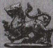
ราชสีห์ทองคำ