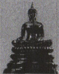
พระพุทธรูปนิคริประธานาถ