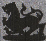
ราชสีห์รมคำ จำนวน ๒๕,๖๕๐ องค์ สำหรับผู้บริจาคเงิน ๕๐๐ บาท