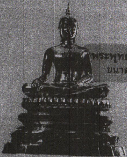
พระพุทธรูปนาคีศรีประธานาธิบดี ขนาดหน้าตัก ๙ นิ้ว

จำนวน ๑,๓๐๐ องค์ สำหรับผู้บริจาคเงิน ๑๓,๐๐๐ บาท