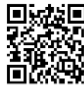
ช่องทางจัดส่งเอกสาร ถอดบทเรียนและวีดิทัศน์